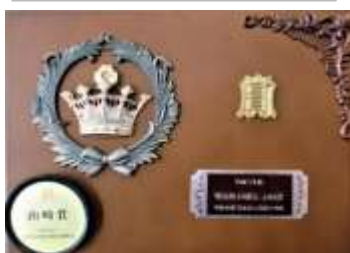
笠原の自然をテーマにした研究で、平成5年、12年に山崎賞を受賞