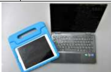
全児童に配布されたiPadとクロームブック