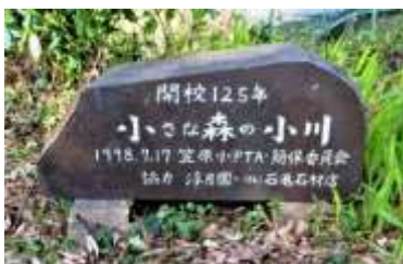
笠小ランド内に小川を造成