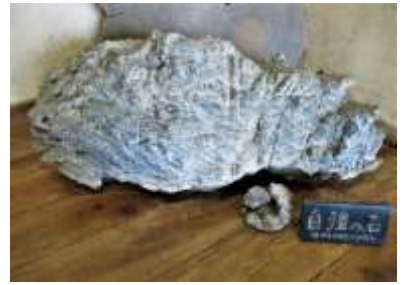
「自分から努力して頑張る子になってほしい」という願いが込められている（PTAより）