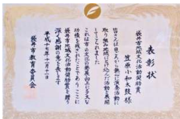
和太鼓 袋井市地域文化活動奨励賞 受賞