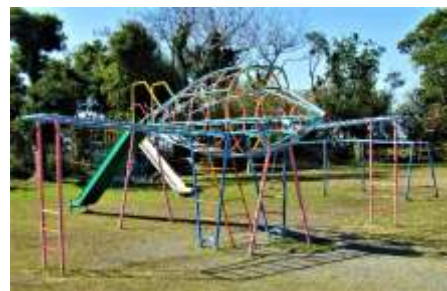
グラウンド南側にある飛行機型の総合遊具