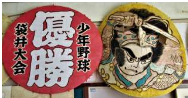
会議室に飾られている丸凧 制作者：竹原善一郎さん