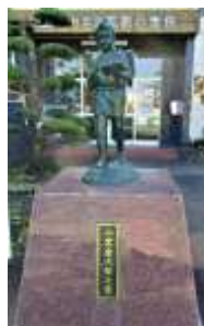
玄関前にある 二宮金次郎像