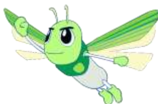
浅羽学園(保幼こ小中一貫教育)がスタート 連携を強化し、15歳の姿を幼小中が共有して一貫した指導を行う 浅羽学園イメージキャラクター あさバッタくん