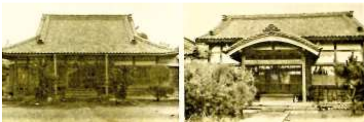
岡崎学校がおかれた宗有寺