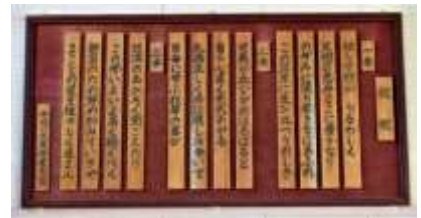
現在も体育館に飾られている平成5・6年度卒業生の記念制作