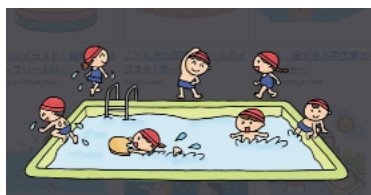
プールをしている様子